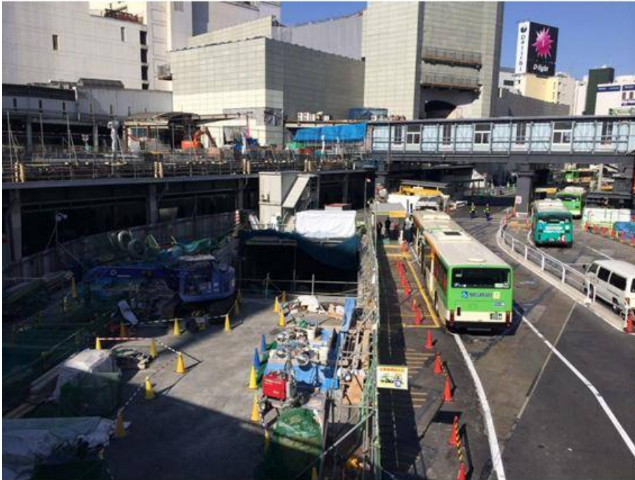
① 渋谷川 現況(H26.1下旬)